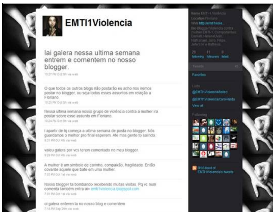
Figura 2: Perfil no twitter