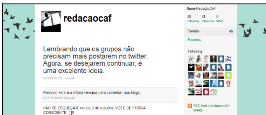
Figura 3: Twitter da disciplina

Assim, o twitter compreendeu também um espaço de acompanhamento do desempenho de cada equipe pelos professores-orientadores, através dos tweets (comentários postados pelos alunos e os professores em seus respectivos twitters , conforme Figura 3). Devido ao caráter público dos perfis criados no twitter , pessoas de fora do projeto também participaram das discussões, evidenciando a grande possibilidade de integração/interatividade que a rede mundial de computadores e suas ferramentas permitem, caracterizando-se como um espaço de produção e socialização de saberes.