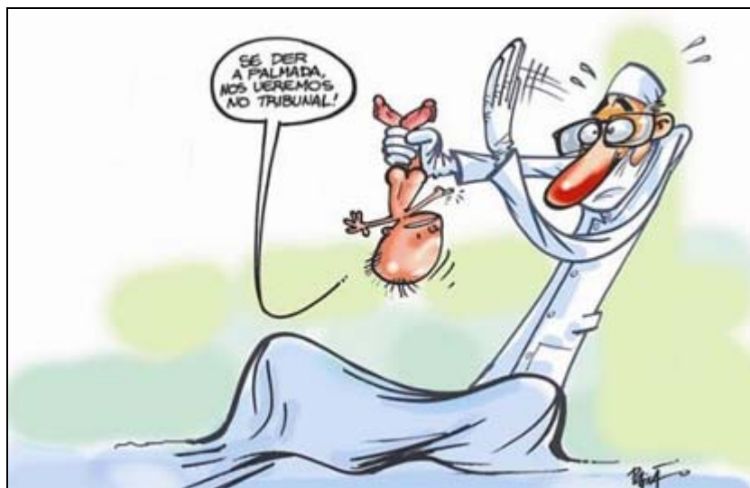
Figura 1: Charge sobre palmada

Fonte: http://nullitos.wordpress.com/2010/08/31/poনারoda-lei-da-palmada/